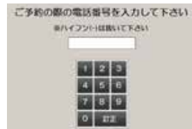
予約時の 電話番号を入力