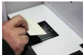
免許証をスキャン