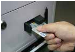
お支払い (クレジット決済のみ)