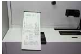
貸渡し証 (兼レシート) 印刷